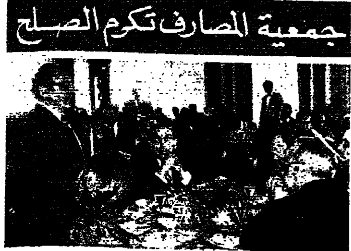
تلقب جمعية مصرف لبنان طرابلس، مدينة غددا في نقل «السان»

وقد توبلت حملة المداهمات التي قامت بها وزارة الاقتصاد والتجارة، بارتياح في الأوساط التجارية والعمالية المتعددة، وقد بدأ يبرهن، وهو خطر تهديد تطبيق نظام بيلقة التوزيع، حيث يجري البيع على أساس بيلقة الهوية، وعدد أفراد العائلة، وكذلك تراخي كيلو واحد للفرد شهرياً، وذلك بانتظار الانتهاء من طبع بيلقات التوزيع، وتوقيع ما يرازي نصف مليون ليرة يومياً.